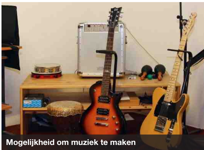
Mogelijkheid om muziek te maken