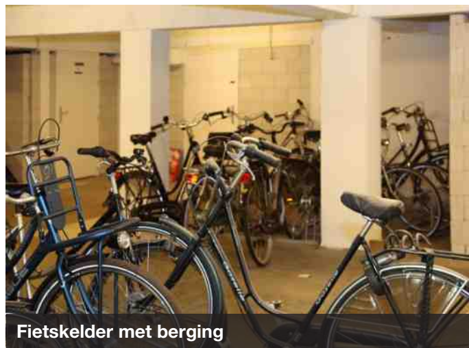
Fietskelder met berging