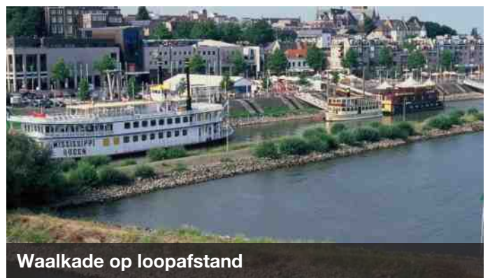
Waalkade op loopafstand

We werken samen met andere GGZ instellingen en organisaties die mensen met autisme begeleiden, om samen de beste ondersteuning te kunnen bieden aan onze bewoners.