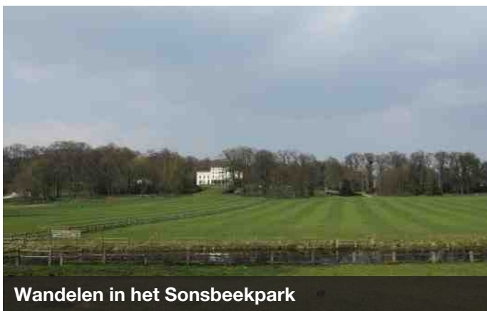
Wandelen in het Sonsbeekpark

Een gezonde leefstijl is belangrijk. Locatie Van Muijlwijk beschikt over abonnementen voor de lokale sportschool en zwembad "De Koppel", waar bewoners kosteloos gebruik van kunnen maken. Dit om een gezonde leefstijl en sporten te stimuleren. Daarnaast kunnen bewoners heerlijk wandelen in het nabijgelegen Sonsbeekpark.