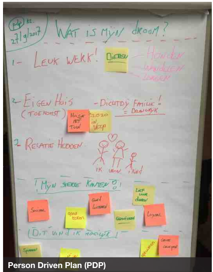
Person Driven Plan (PDP)